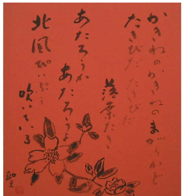
たきび 色紙 左は2番、右は1番の歌詞

当初は、12月9日から3日間放送される予定でしたが、前日の12月8日に日米開戦を迎えてしまったため、戦時特別番組が組まれ、放送は2日間で打ち切られてしまいました。