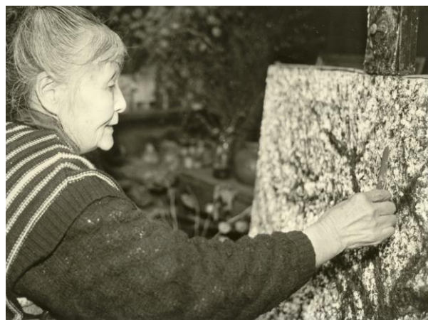
晩年の野村千春(平成 2 年)

野村千春の絵について、師の中川一政は「女流画家ではあるが、女流の繊細とか優美とかに全く背を向けている」と評しています。力強い大地(土)の描写と、生命力を感じさせる花の絵に定評があり、多くの人々を魅了してきました。暗い画風のなかに光る色彩の美しさは、晩年になるほど輝きを増しています。長女の中川やよひさんは、「こんな迫力のある絵を女が書けるはずがないという、展覧会観覧者の感想を、とても喜んだ」というエピソードを語ってくれました。日本の女流画家の草分けとして活躍した一生でした。